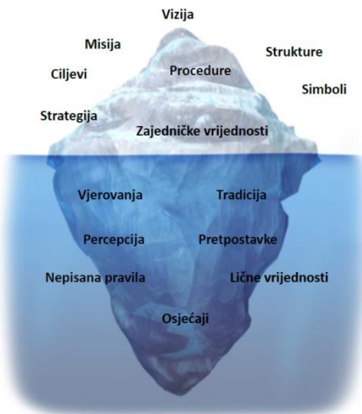
Slika 2: Vidljivi i nevidljivi aspekti kulture

U kolaborativnim kulturama , profesionalni razvoj nastavnika je baziran na njihovoj međuovisnosti i u uvjetima gdje postoji konsenzus o moralnim i obrazovnim vrijednostima. Pomoć, podrška, povjerenje,